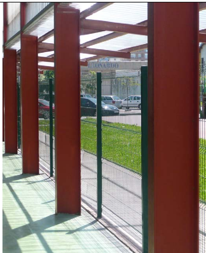
El PRC solicita que se forren de espuma las vigas de hierro para mayor seguridad de los jugadores.