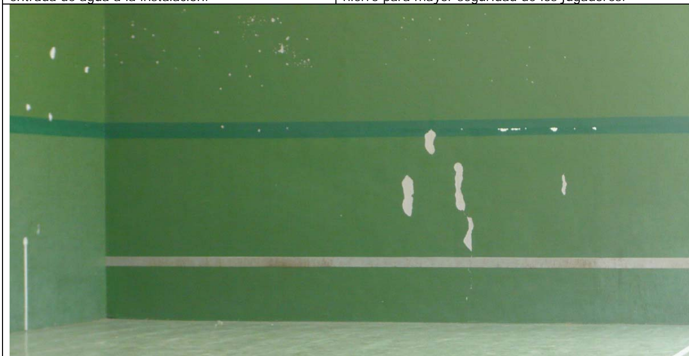
Los desconchones y agujeros dificultando el desarrollo normal del juego y ofreciendo una imagen de desidia y dejadez.