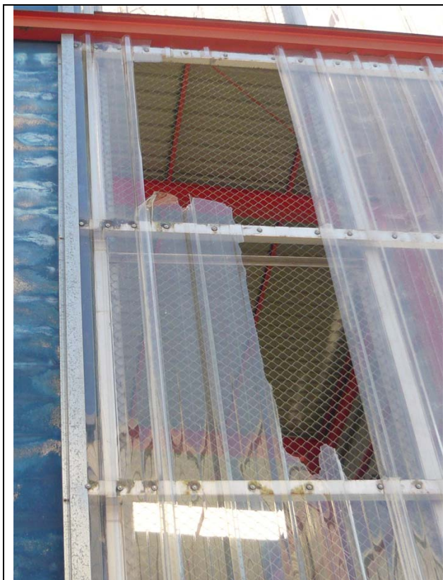
Desperfectos en cubierta y cerramiento permiten la entrada de agua a la instalación.