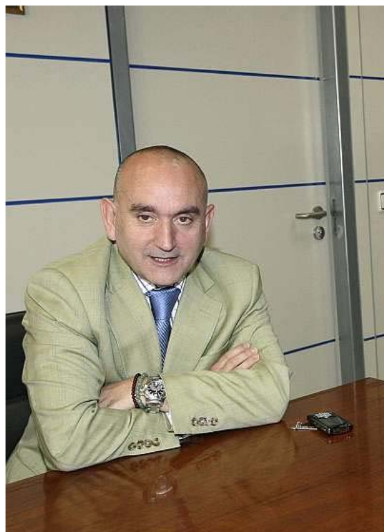
El consejero de Industria de Cantabria, Javier del Olmo (i).

Colindres.- El consejero de Industria y Desarrollo Tecnológico, Javier del Olmo, ha anunciado hoy la creación de un aparcamiento de camiones en Colindres y una red wifi municipal durante una visita efectuada al ayuntamiento colindrés para analizar la colaboración entre las administraciones local y regional.